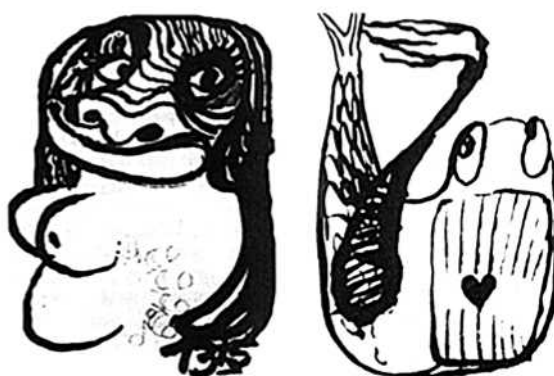
Рис. 1. Изображение «Плохой Матери», передающее испытанную во время сеанса с ЛСД глубокую регрессию на оральный уровень развития. Рис. 2. Глубокая регрессия на раннюю оральную стадию развития либидо, переживавшаяся на психоделическом сеансе. Широко зияющий рот с глоткой в форме сердца отражает характерную для этой стадии